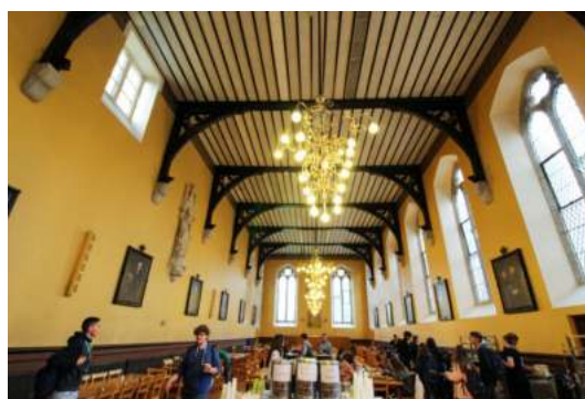
Bild Rechts: „The Hall“, in der die Malzeiten eingenommen werden.

Beide Summerschools liegen ca. 15-20 Minuten mit der Dart (so nennt man die Straßenbahn in Dublin) von der Dublin City entfernt. Die Summerschools haben aber auch eigene Shuttlebusse für Ausflüge und die meisten Cityfahrten.